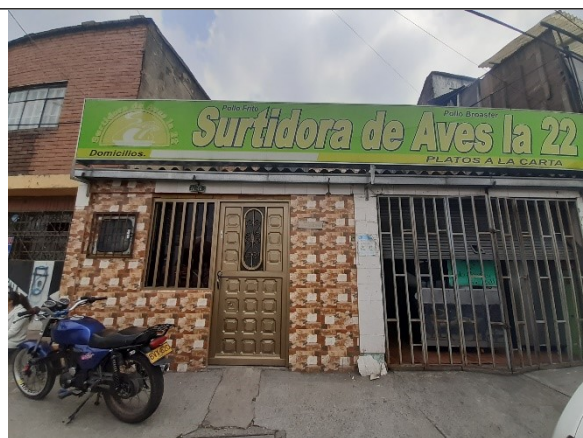
Foto No. 2 fachada del establecimiento