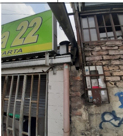
Foto No. 5 ducto