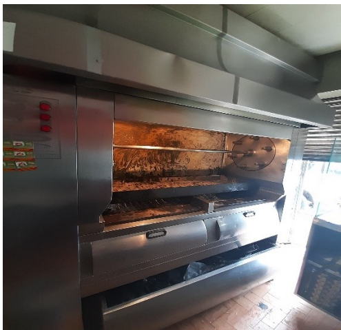
Foto No. 3 horno asador