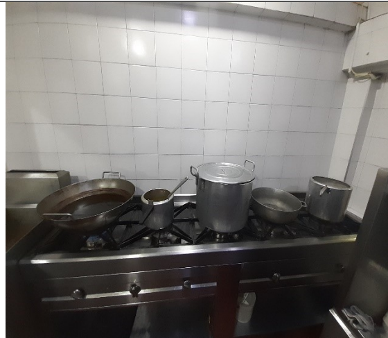
Foto No. 4 estufa