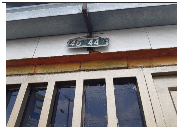
Foto No. 1 nomenclatura del predio